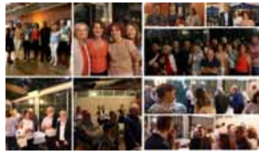
Ankara Tabip Odası, geçen yıl hayata geçirilen Tıp Fakültesi Öğrenci Bursu'na yaptıkları bağışlarla katkıda bulunan hekimlere teşekkür etmek...